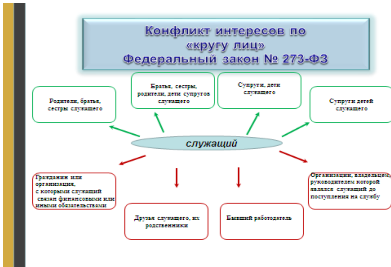
Рис.3 Определение «конфликта интересов» в Федеральном законе № 273-ФЗ.

Общее представленных выше понятий заключается в их структуре. Несмотря на то, что конфликт интересов возникает у одного лица, наделенного властными полномочиями, в структуре имеется две стороны, поскольку реализуется конфликт чаще всего во взаимодействии двух и более сторон, которые при этом состоят в определенной связи. Хотя не исключено получение выгоды должностным лицом для самого себя. Так, вот объем лиц, отнесенных к одной и к другой стороне, и определяют различные объемы приведенных выше понятий.