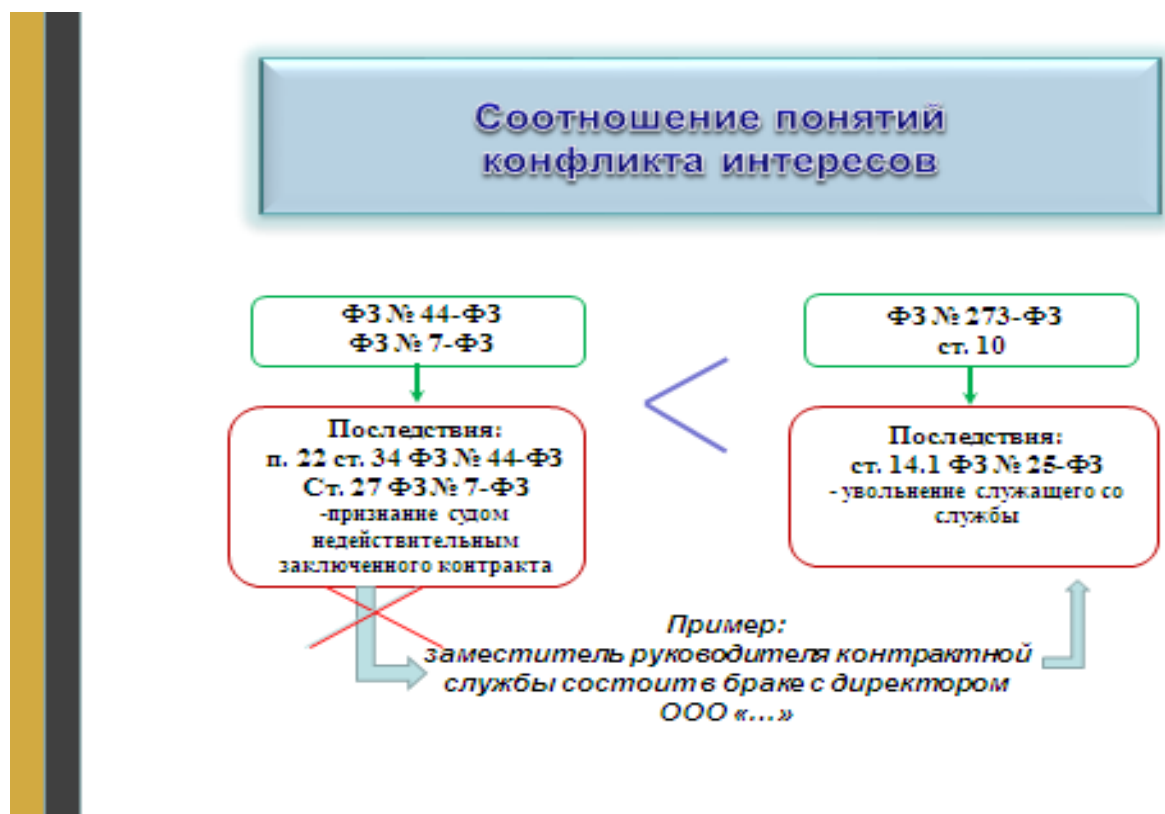
Рис.4 Соотношение понятий «конфликта интересов».

При этом указанные законы предусматривают разные последствия за допущение ситуации конфликта интересов. Федеральный закон № 44-ФЗ обязует комиссию по осуществлению закупок принять решение об отстранении участника закупки от участия в определении поставщика или отказать в заключении контракта с победителем в случае установления конфликта интересов. Нарушения требования о недопущении конфликта интересов влечет ничтожность государственного контракта на основании пункта 2 статьи 168 Гражданского кодекса Российской Федерации. 4